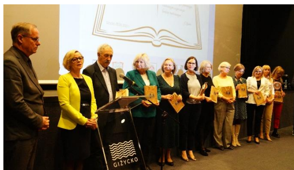
Aktualni i byli pracownicy Powiatowej Biblioteki Pedagogicznej w Giżycku. Obok – koordynatorzy lub dyrektorzy reprezentujący wszystkich partnerów.