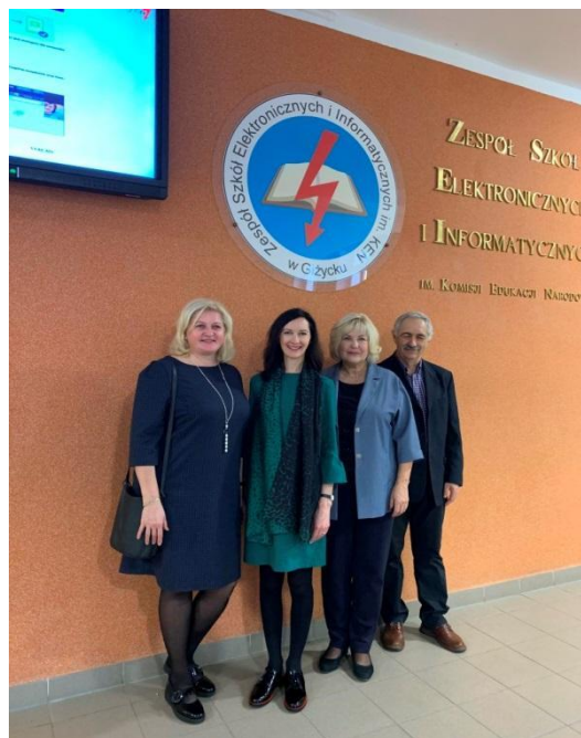
Nuotrauka. Elektronikos ir IT mokyklų direktorių grupė iš Latvijos