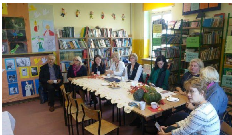
Nuotrauka. Grupė mokyklos bibliotekoje Rydzewo pradinėje mokykloje

Apsilankę itin sausakimšoje Giżycko mokykloje, svečiai užsuko į jaukią Rydzewo pradinę mokyklą.