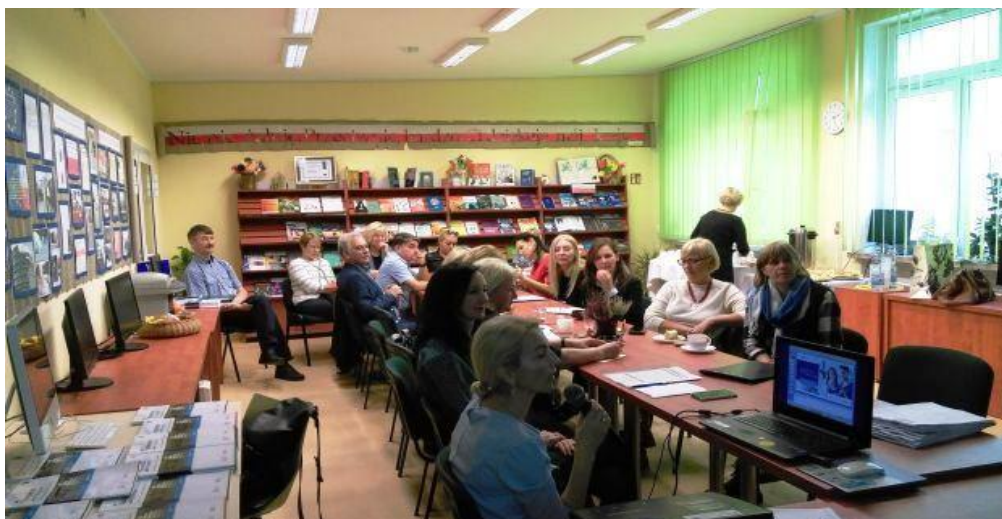
Nuotrauka. Visa projekto komanda Poviato ugdymo plėtotės centre Giżycke.