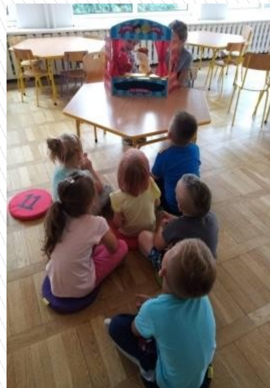
Zabawy w teatr