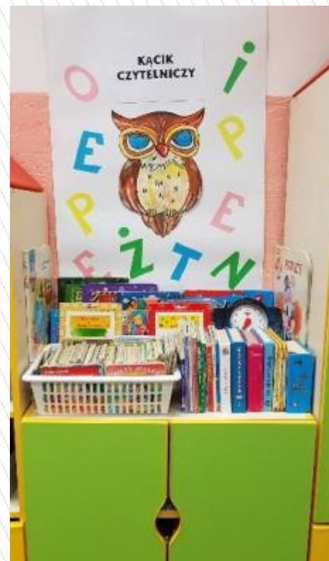
kącik czytelniczy dzieci 3–4 letnich