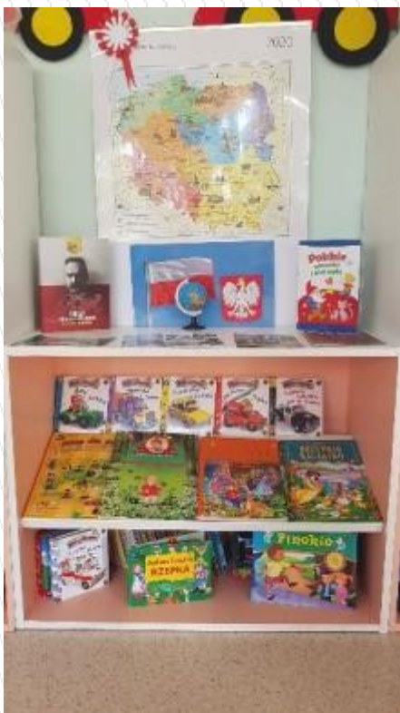
kącik czytelniczy dzieci 5–6 letnich

W każdej grupie wiekowej założone są kąciki czytelnicze.