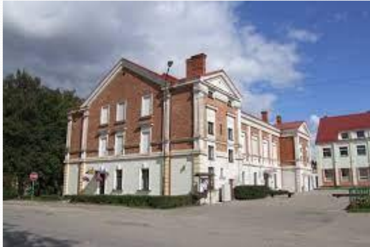
Zaļenieki parish library Centra street 1, Zaļenieki, Jelgava region